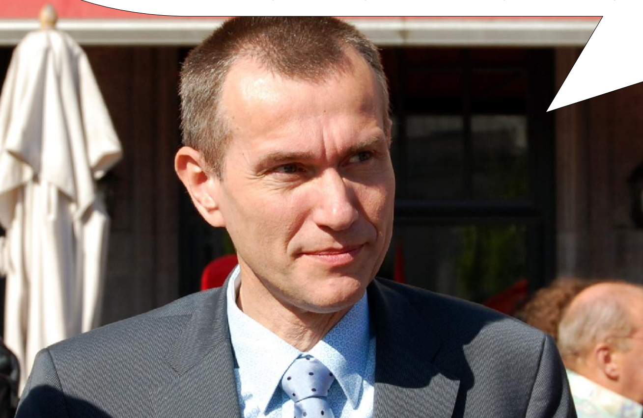
Frank Vandembroucke 20 oktober 2004